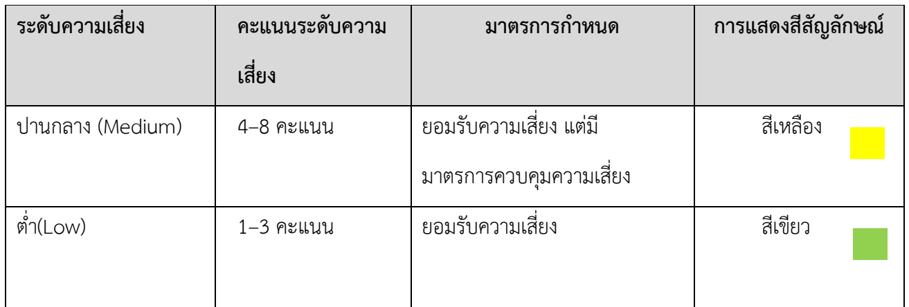
ตารางระดับของความเสี่ยง (Degree of Risk)